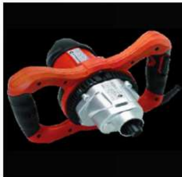
Figura 8-2: Mezcladora Rubi® de baja velocidad.