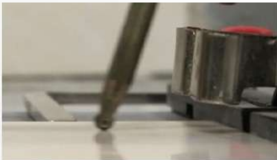
Figura 8-3: Cortadora Rubi® Estándar y Profesional.

Las cortadoras con disco diamantado pueden ser eléctricas o neumáticas. Permiten cortar, tanto en seco como con agua, dependiendo de las características del disco de corte. Su uso requiere mayor destreza en relación con las cortadoras estándar, pero sirven para cortar una mayor variedad de revestimientos como adoquines de cemento o piedra natural y, además, pueden hacer cortes parciales o curvos en una misma unidad de revestimiento. Este equipo se muestra en la figura 8-4.