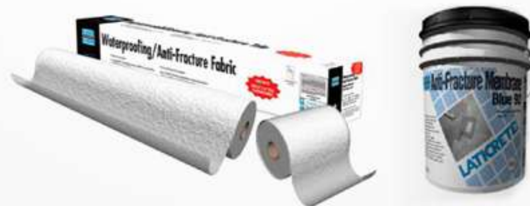
Figura 8-1: Membrana antifractura.

Ejemplos de este tipo de productos son: La membrana Laticrete® Blue 92 y Laticrete® Crack Suppresion Kit, presentadas en la figura 8-1.