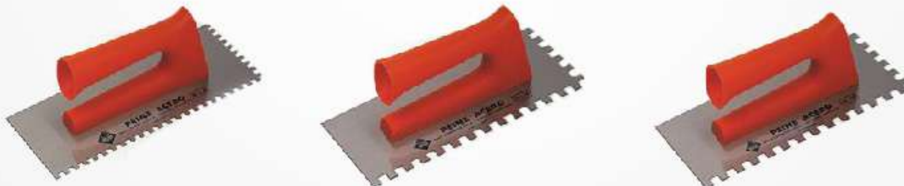
Figura 8-7: Algunos tipos de llanas dentadas para la instalación de unidades de revestimiento

Las llanas dentadas son herramientas indispensables para un instalador profesional de revestimientos (ver figura 8-7). La llana está conformada por una lámina rectangular de acero, preferiblemente inoxidable, con dientes en un lado largo y en un lado corto; y sin dientes o lisas, en los otros dos lados. La altura de los dientes está graduada de acuerdo al requerimiento de la instalación. Mientras más grandes sean los dientes, más adhesivo se aplicará. El tamaño adecuado del diente para cada tipo de unidad de revestimiento se hace con la ayuda de los datos encontrados en los empaques de los adhesivos de la familia Pegacor®, y dependen de la planimetría del sustrato y del formato de revestimiento que se instalará. La figura 8-8, es una guía rápida de selección de la llana e indica la cantidad de adhesivo que deposita sobre el mortero de nivelación o de pañete. El uso de la llana dentada le permite al instalador controlar el espesor de pegante que aplica. Esto es importante porque ayuda a controlar los consumos de pegante y a que la unidad de revestimiento se asiente correctamente, es decir, que el pegante quede en contacto con la unidad de revestimiento en más del 95% de la superficie de la unidad de revestimiento.+