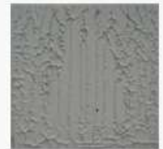
Cubrimiento del 100% por doble encolado