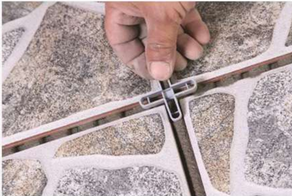
Figura 8-11: Crucetas y su forma de uso .

Las crucetas se ponen en los vértices que conforman las unidades de revestimiento colocándose en aparejo de petaca (ver sección 4.5).