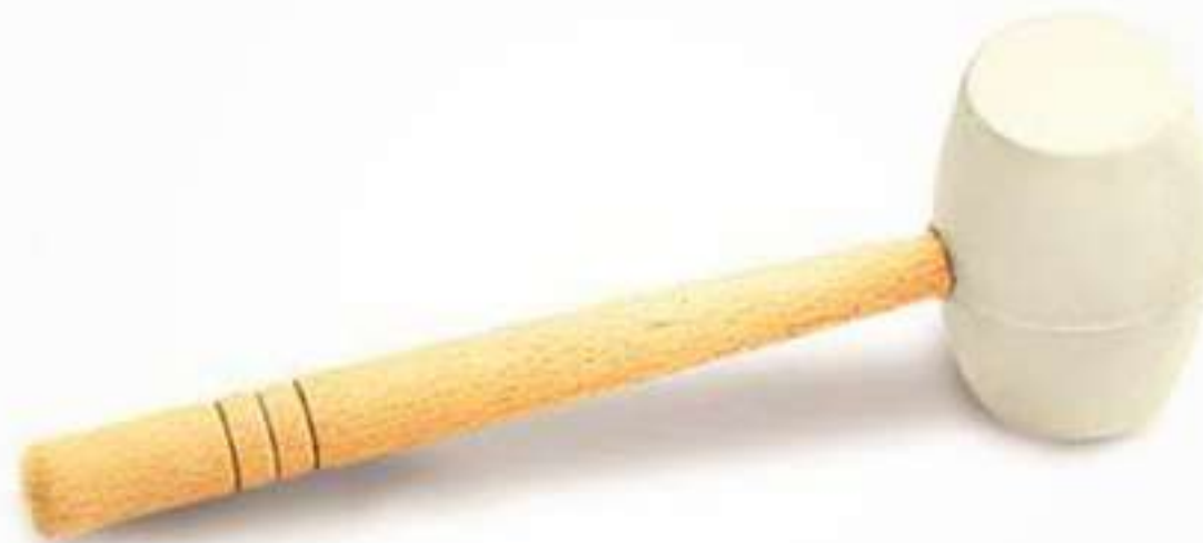
Figura 8-13: Mazo de goma blanco Rubi® para colocación de unidades de revestimiento.

Aunque los mazos de goma o caucho más comunes son de color negro, se recomiendan los blancos porque los negros pueden manchar el revestimiento si éste es de color claro.