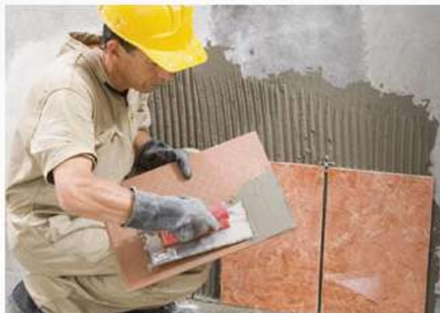
Figura 8-10: Llana de caucho Rubi®.